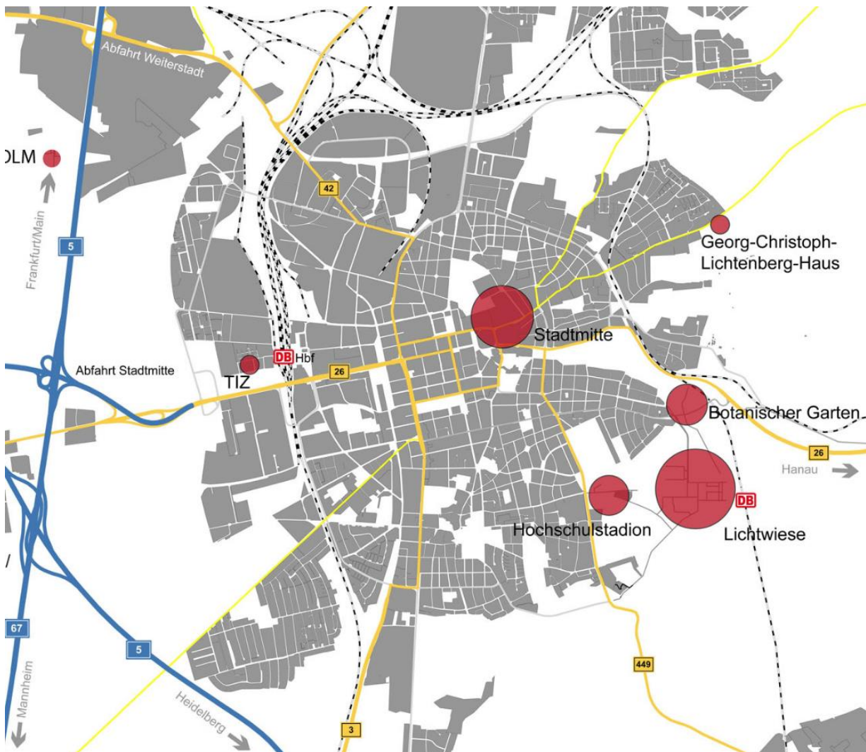
Abb. 1: Standorte der TU Darmstadt

Für die weitere Orientierung ist weiter unten der Lageplan des Standorts Stadtmitte aufgeführt mit den genannten Haltestellen. Über das Campusnavi kann man sich auch den Campus in 3D anschauen ( http://www.sight-board.com/tu-darmstadt/?redirect ).